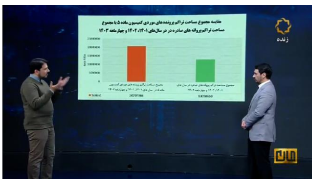
شکل ۴. نمونه‌هایی از اخبار مطرح در رسانه‌ها در مورد عملکرد کمیسیون ماده پنج

یکی دیگر از اقداماتی که شهسازان در خصوص موضوع کمیسیون ماده پنج شهر تهران، برای پاسخ به دغدغه‌ها و مسئولیت‌های اجتماعی خود انجام داده‌اند، مصاحبه با رسانه‌ها (مطبوعات و صداوسیما) بوده است. گرچه مباحث معماری و شهرسازی ممکن است در بدو امر موضوعاتی تخصصی و نخبگانی به حساب آیند، ولی این تجربه نشان داد که طرح دقیق موضوعات و تبیین ابعاد اثرگذاری آن بر زندگی مردم می‌تواند باعث شود اهمیت موضوع برای رسانه‌ها و افکار عمومی ملموس گردد.