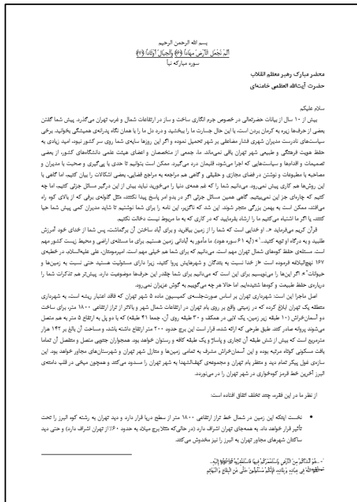
شکل ۵. بخشی از نامه تهیه‌شده برای مقام معظم رهبری

یکی از کارهایی که برای جلوگیری از برخی از آسیب‌های عملکرد شهرداری تهران و به‌ویژه کمیسیون ماده پنج شهر تهران در دستور کار گروهی از شهروندان قرار گرفت، تهیه نامه برای مقام معظم رهبری است. به‌جز این نامه، پیگیری‌هایی از طریق معاون شهرداری و معماری وزارت راه و شهرسازی و مدیر دبیرخانه شورای عالی شهرداری و معماری کشور نیز صورت گرفت و مراتب امر به اطلاع ایشان رسید.