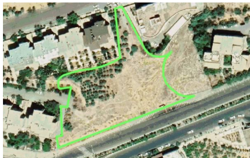
شکل ۱. موقعیت زمین پرونده موسوم به هتل ولنجک

- نمونه دیگر ابلاغ صورت جلسه برای صدور مجوز برای احداث یک هتل سی طبقه روی همکف (از گذر شمالی که خود چندین طبقه بالاتر از گذر جنوبی است) در بالاتر از خط تراز ارتفاعی ۱۸۰۰ متر شهر تهران در شمال محله ولنجک است. این مصوبه با تنها سه امضای موافق به شهرداری منطقه ابلاغ شده بود و بر اساس آن پروانه صادر شده بود. در حالی که تبصره ۳ ماده ۵ قانون تأسیس شورای عالی شهرسازی و معماری کشور تصریح دارد که مصوبات این کمیسیون با دست کم چهار امضا اعتبار پیدا می‌کنند.