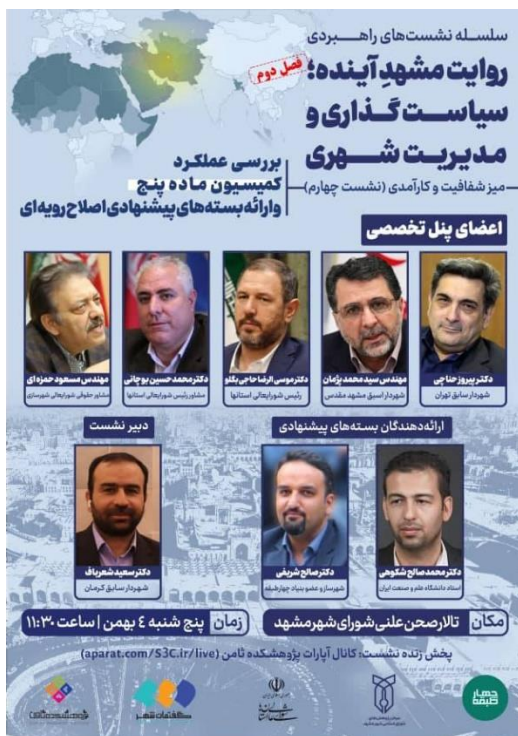
شکل ۸. تصویری از یکی از نشست‌های تخصصی برگزار شده در مورد کمیسیون ماده پنج و پیامدهای رویکردهای حاکم بر آن

نشست دیگری در شهر مشهد برگزار شد که حاوی دو پیشنهاد درباره کمیسیون‌های ماده پنج بود: یکی در خصوص کمیسیون ماده پنج شهر تهران و دومی در خصوص کمیسیون ماده استان خراسان (که احتمالاً قابل‌تعمیم به کمیسیون‌های ماده پنج در استان‌های دیگر هم خواهد بود). در این نشست نیز برخی از استادان و صاحب‌نظران، در کنار تعدادی از مدیران و سیاست‌گذاران شهری، موضوع کمیسیون ماده پنج و شیوه‌های ممکن برای اصلاح فرایندهای حاکم بر آن را مورد بررسی قرار دادند.