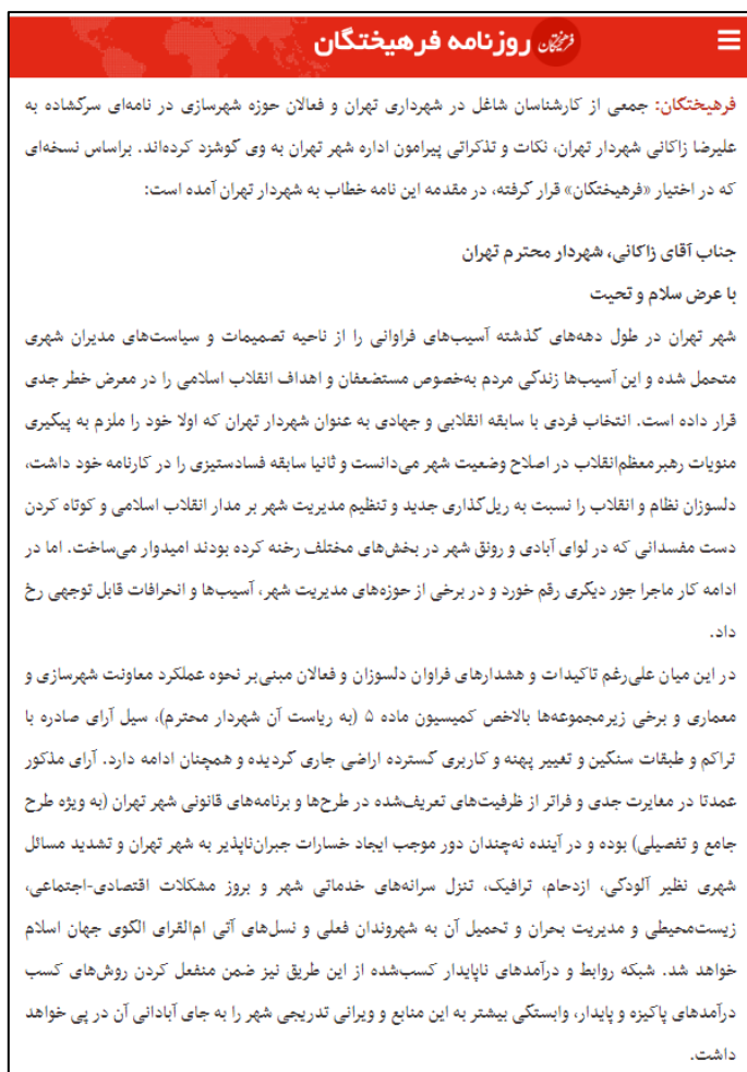
شکل ۵. نمونه‌هایی از بیانیه‌های منتشرشده در مطبوعات

تدوین‌شده بود. جالب اینکه هر دو بیانیه بدون ذکر نام منتشر شدند که نشان می‌دهد احتمالاً نگرانی‌هایی از پیامدهای احتمالی انتشار چنین بیانیه‌ای داشته‌اند.