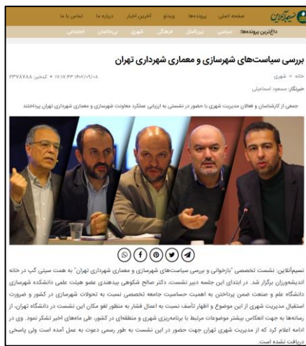
شکل ۶. خبر خبرگزاری نسیم آنلاین در مورد نشست تخصصی بررسی سیاست‌های شهرداری و معماری شهرداری تهران