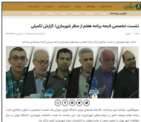
شکل ۷. خبر برگزاری نشست تخصصی در مورد برنامه هفتم که در آن به موضوع پیشنهاد حذف تبصره ۳ ماده ۵ نیز در متن اولیه لایحه برنامه اشاره شد.