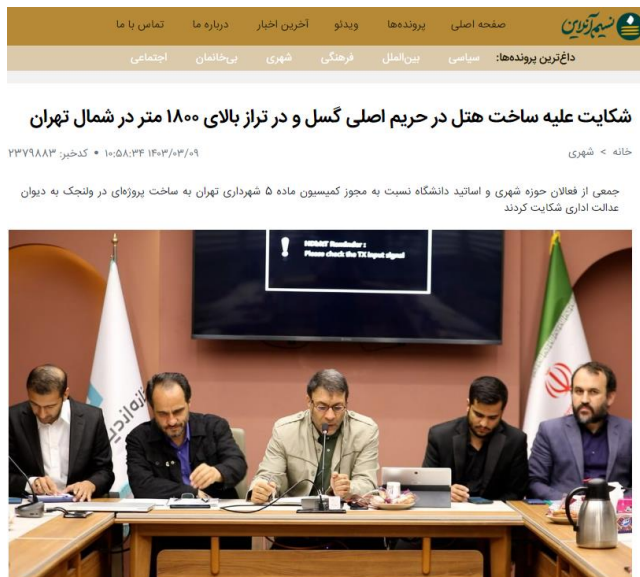
شکل ۳. تصویر خبر برگزاری کنفرانس خبری استادان و متخصصان در مورد شکایت علیه

یکی دیگر از راهکارهای به کار گرفته شده از سوی شهروندان برای محدود کردن اقدامات غیراصولی در کمیسیون ماده پنج شهر تهران، برگزاری کنفرانس مطبوعاتی و نشست خبری بوده است. پس از طرح شکایت استادان دانشگاه علیه صورت جلسه کمیسیون ماده پنج برای صدور مجوز ساخت برای هتل شمال ولنجک، یک نشست خبری از سوی استادان دانشگاه و متخصصان شکایت کننده در این پرونده برگزار شد که ابعاد فنی موضوع و روند پیشرفت پرونده به اطلاع ارباب جراید رسید.